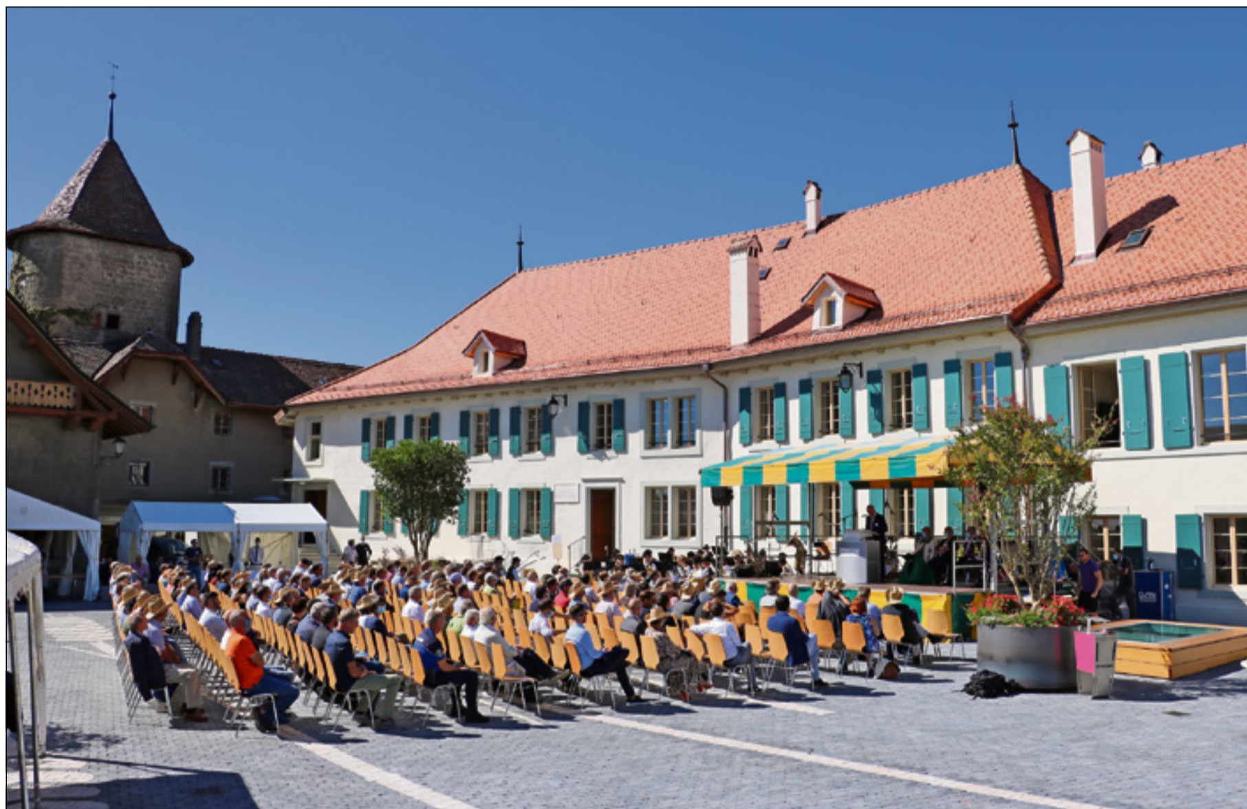
Près de 300 invités ont participé vendredi passé à l'inauguration officielle du château d'Echallens rénové.

Plusieurs orateurs, dont la conseillère d'Etat Béatrice Métraux, sont intervenus lors de la partie officielle organisée sur invitation vendredi passé. Les portes ouvertes pour le grand public seront organisées dès que possible.